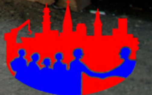
Aufbau Kinderlounge 2013, Lombardsbrücke

FreiwilligenBörse Hamburg Agentur für bürgerschaftliches und wirtschaftliches Engagement Träger: Bürger helfen Bürgern e.V. Hamburg