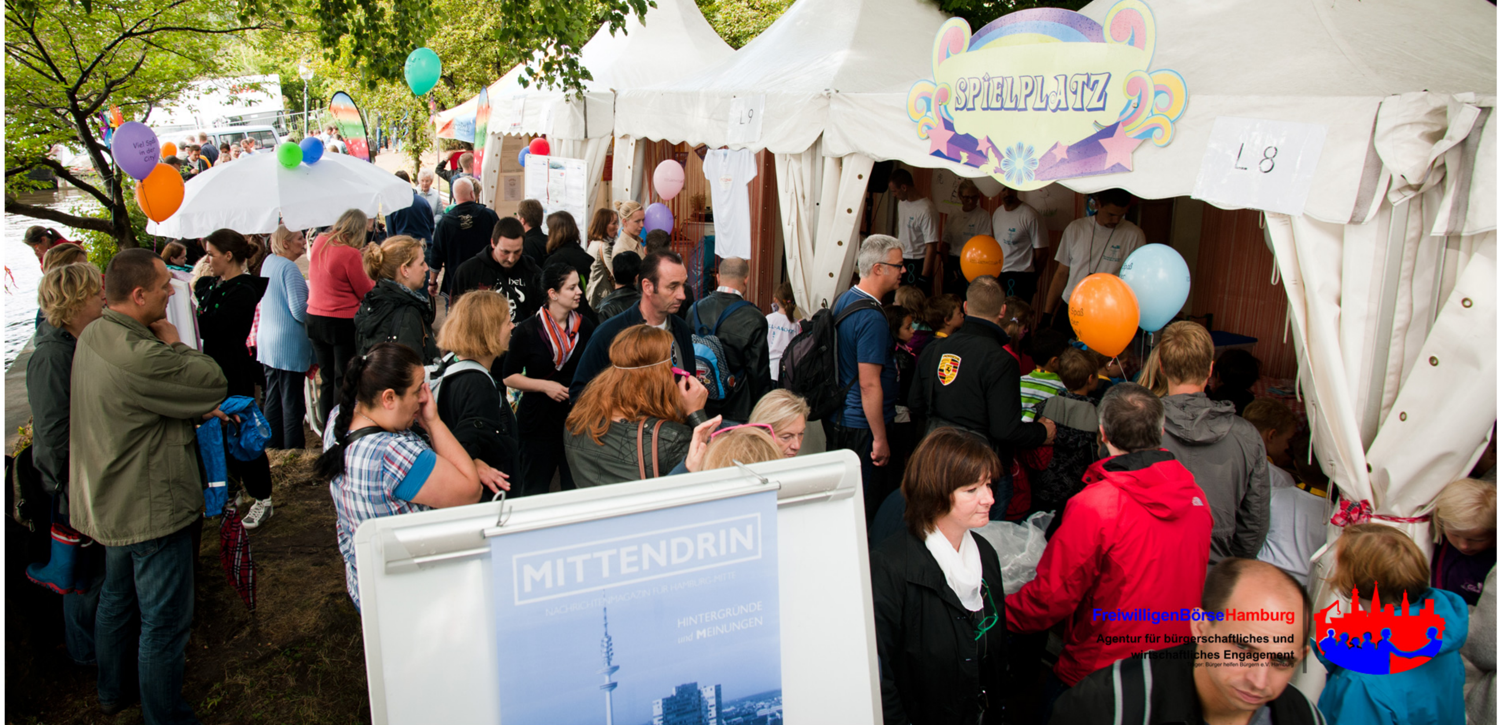
Besucher Kinderlounge 2013

Hier entstehen Synergien zwischen Wirtschaft und Bürgerengagement zum Wohle unserer Metropole Hamburg.