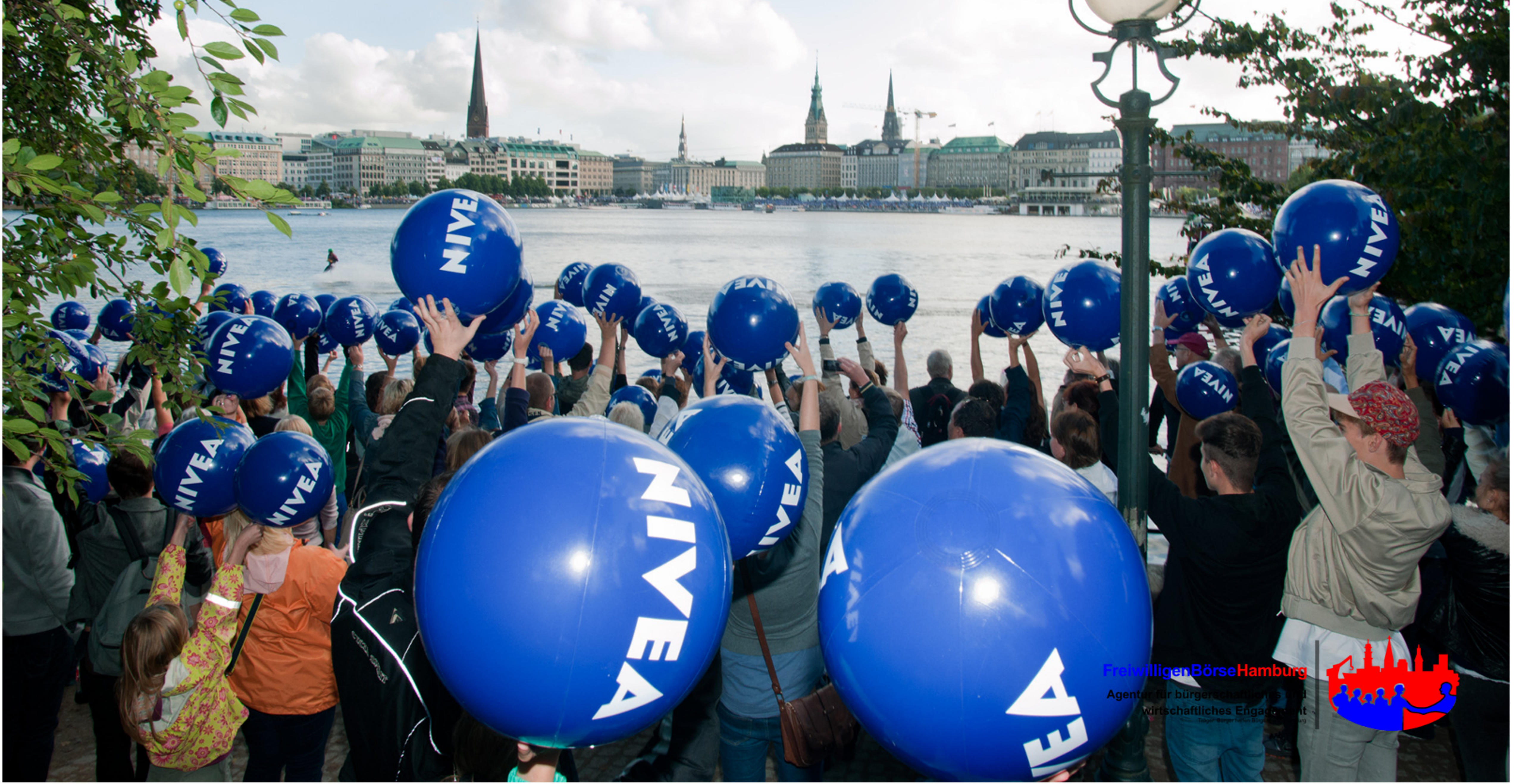
Nivea Werbeaktion Alstervergnügen 2013