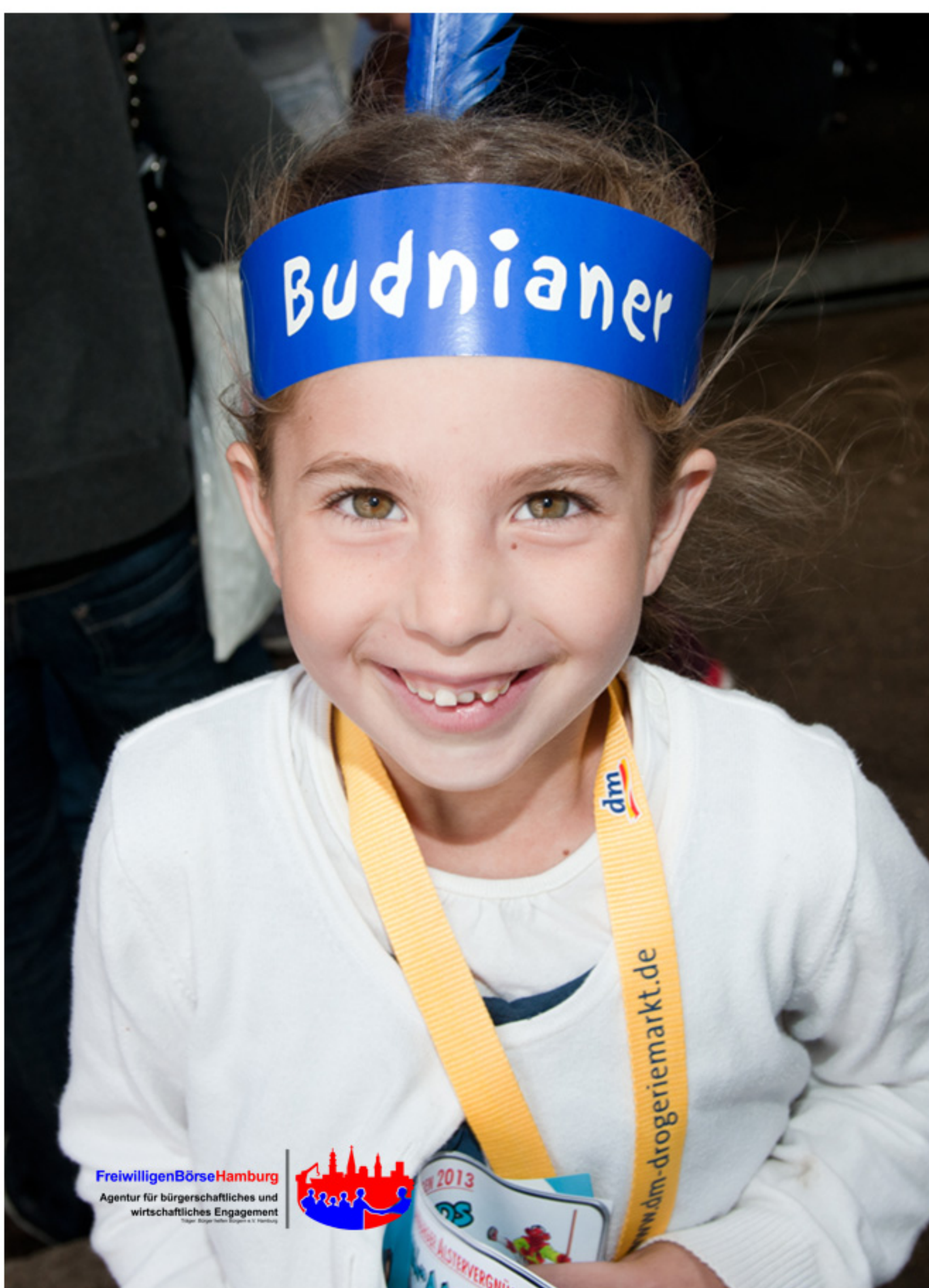
Partner Kinderlounge 2013 // Foto: R. Holst